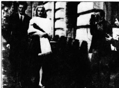
Ἁ δημοσιογράφος καί ἡ στάρ στή Ρώμη. «Ντόλτσε Βίτα» (1959)