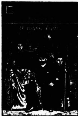
Μετάφραση Άλέξανδρος Ίσαρης

Ξένοι πεζογράφοι σέ υπεύθυνη μετάφραση καί φροντισμένη έκδοση.