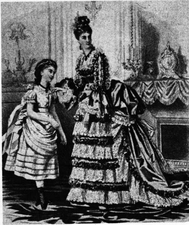
Ἐξαδέλφη καὶ Θεία (Ἀναπαράστασις)

Ἐνῶ ἡ δόνα Ρωξάνη πῆρε τὸ γιό καὶ τὴν ἀνηψιά της στὸν κήπο, ὁ ἄνδρας της μπῆκε μόνος στὸ γραφεῖο του γιὰ νὰ ἐξετάσει τὴν ἀλληλογραφία πού μαζεύτηκε κατὰ τὴ διήμερη ἀπουσία του. Ἄνοιξε ἕναν παχουλὸ φάκελο· ἦταν ἀπὸ τὸν συμβολαιογράφο πού εἶχε ἐπιφορτισθεῖ τὴ διαθήκη τοῦ γυναικαδέλφου του, Ραμόν Ὁλοθουρία. Ὅπως τὸ εἶχε προαισθανθεῖ, ὁ πατέρας τῆς Καικιλίας δέν φαίνεται νὰ εἶχε περισσὰ χρήματα. Ὁ δὸν Ἀριστείδης ἔνιωσε ἕνα κύμα φρίκης νὰ τὸν πλημμυρίζει ὅταν σκέφτηκε ὅτι θὰ ἔπρεπε νὰ ἐπιχορηγῆ τὴν ἀνηψιά του μέχρι τὴν ἐνηλικίωσή της· μηχανικά, τὸ χέρι του κατευθύνθηκε σὲ μιά σειρά πίπες, διάλεξε μιά κυρτή, τὴν γέμισε καὶ σύντομα τὸ δωμάτιο ἦταν γεμάτο καπνοῦς σχεδὸν συμπαγεῖς. Τότε πρόσεξε τὸ ὄμορφα τυλιγμένο πακέτο πού βρισκόνταν πάνω στὸ γραφεῖο. Ἀδιάφορα τὸ πῆρε στὰ χέρια του καὶ τὸ ψηλάφησε· κάτω ἀπὸ τὸ φλόγκο βρῆκε μιά λευκὴ κάρτα· μέ βιαστικά καὶ συσπασμένα γράμματα, ἡ ἀνηψιά του τοῦ εὐχόταν νὰ χαρῆ τὸ δῶρο της. Ὁ δὸν Ἀριστείδης χαμογέλασε παρατηρώντας ὅτι ἡ ὑπογραφή ἦταν «Καικοιλία», ἄνοιξε τὸ κουτί· τὸ χαμόγελο πάγωσε στὰ χεῖλη του· τινάχτηκε ἀπ' τὸ κάθισμά του, πῆγε στὸν τοῖχο, κατέβασε τὸ δίκαννο, χούφτωσε μερικά φυσιγγία.