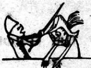
Φασουλή, και Περικλέτος, δ καθένας νέτος σκέτος.

! 'Αφού με δρέκανον δέν θάρεθαι κι' ή κόλαρα και σόν όσφ έλιπίσμεν να πάση κι' έδω πάρα, άφου τ' παρσίλωσ' κι' εκείν' ή βρωμοέστη και διαδάλειον φρεσών ή κάρη μας όπισθη, για τόσο μπόστ'ια, δλ' αυτά, μα μένωσ' στον σκοπόν πούσ' να βγαίνη ο 'Ρώμηος για ένα μήνα μόνον.