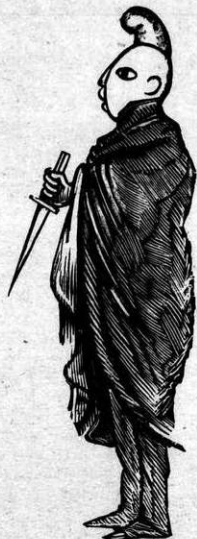
Φασουλῆς ὁ πατριώτης ὡς γενναῖος συνωμότης.

μὴν τὸν ἀκούσης, Βασιλεῖα, κί' ἄς πᾶν νέ κουρεύεται... λαγὸς τῆ φτέρη ἐτριβε κακὸ τῆς κεφαλῆς του. Κί' ἂν τοὺς δεσμοὺς τοῦ φοβεροῦ Συντάγματος του σπάσης πάλι θά μείνῃ κύριος ἑπικραματίας πάσης.