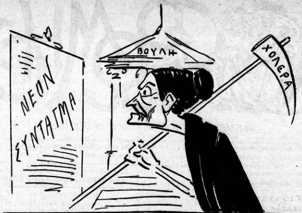
Τὸ Σύνταγμα τὸ νέον γὰρ σκιάχτρο καὶ φοβέρα τὸ βλέπει κί' ἢ Χολέρα.

τὸν Μαρία, τὸν Σουμαρία, κί' ἔγιναν καμπόσοι σκίπια.