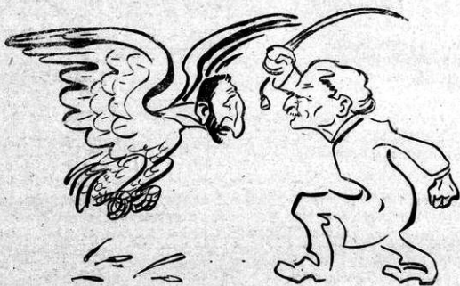
Ἄετός καὶ Ξίφος, καὶ τὰ δύο τξίφος.

Γοῦ Γοῦ Γοῦ Γοῦ καὶ Ρὰ Ρὰ Ρὰ φωνάζουν μὲς ὀτὴ συμφορὰ καὶ ὄτὸν καιρὸ τῆς πείνας.