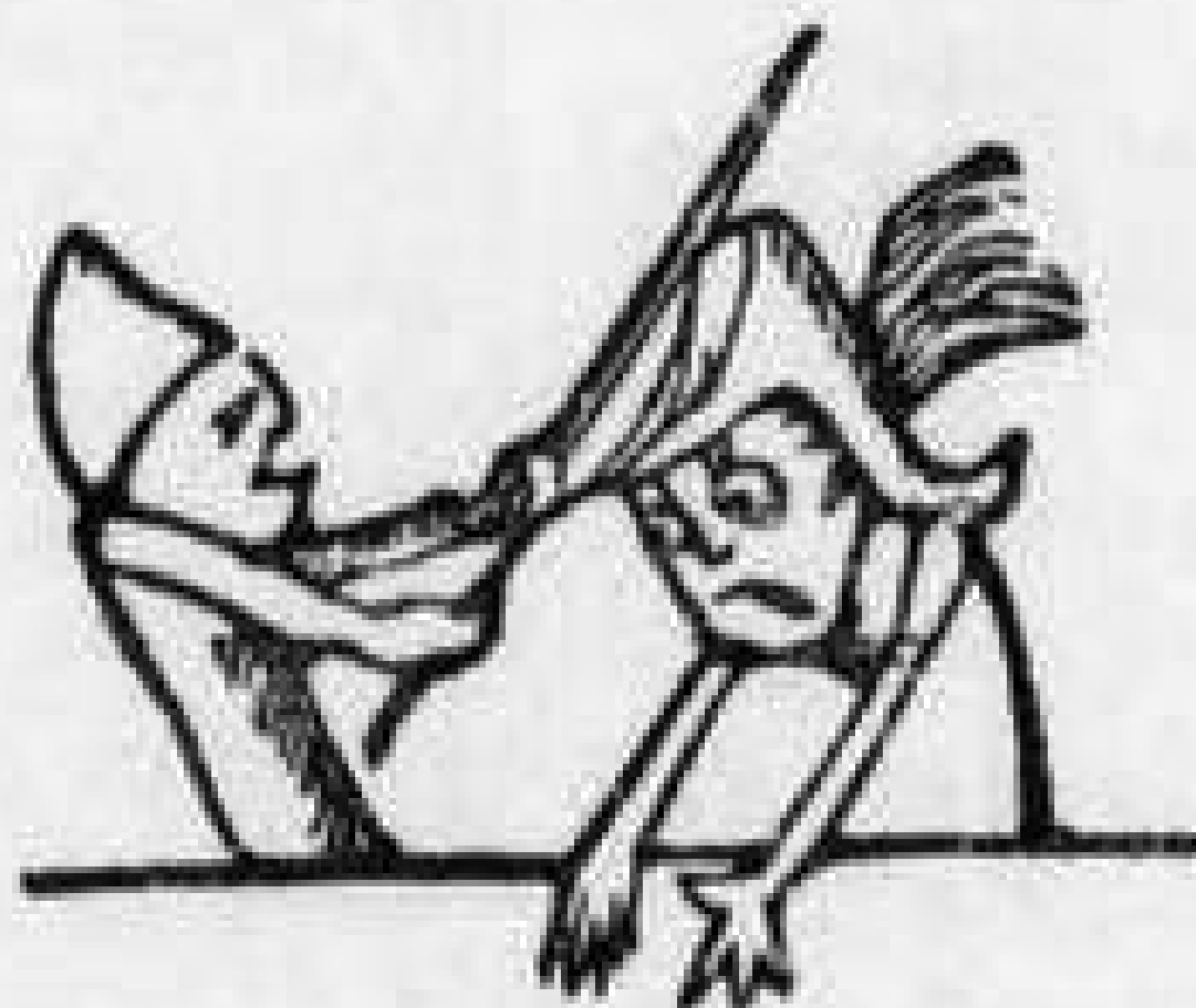
Φασουλῆς και Περικλέτος, ό καθένας νέτος σκέτος.

Έβδομη Δεκεμβρίου και δεκάτη κι' ό Σπάρταλης το έθνος συνταράττει.