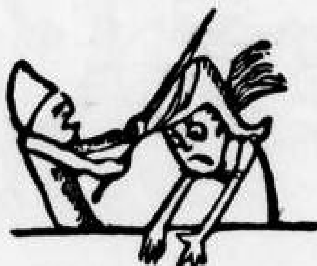
Φασουλής και Περικλέτος ὁ καθέννας νέτος σκέτος.

Π.—Καλῶς τὰ μάτια σου τὰ δρό... καλῶς μᾶς ἦλθες, ξένε !.. ἀπὸ τὴν Πόλι ἔρχεσαι :