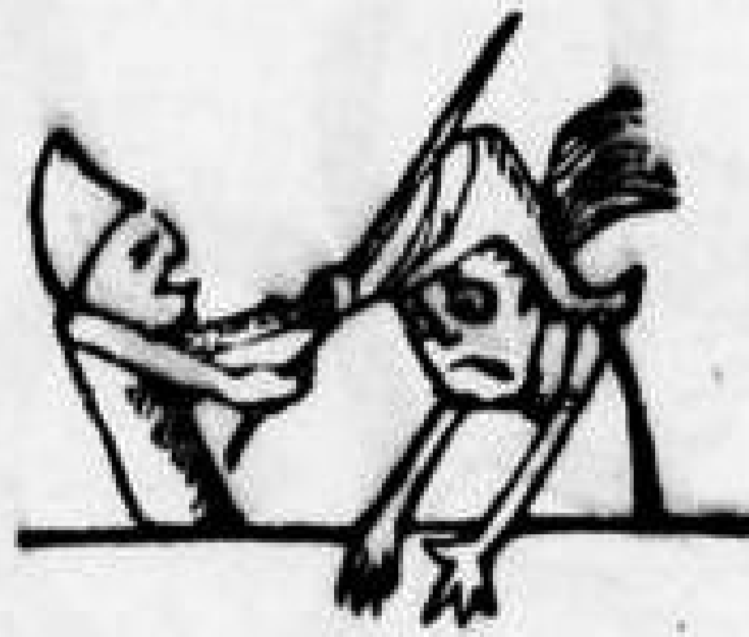
Φασουλῆς καὶ Περικλέτος, ὁ καθέννας νέτος σκέτος.

Φ.—'Ιώ! ἰώ! δεινὰ δεινῶν!.. ὦ κόσμε κί' οἰκουμένη! ὦ ποντικοὶ τῶν ὀχετῶν τοῦ Πειραιῶς πρισμένοι!