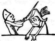
Φασουλῆς καὶ Περικλέτους, ὁ καθένας νέτος σκέτος.

Ἐν μέσῳ παντοίων πληθῶν ἀνηκέστων τὸ αἶμα σας εἶναι παρήγορον δῶρον, κ' ἐγὼ διὰ σίχων γοργῶν κ' ἀναπαίστων ὄμνῶ τὸ στήλαρι τοσοῦτον σιγῶν, κ' ὦ; φάρους κυττάω σ' τοῦ ἐθνους τὰ χάλια σπασμένα ρουθούνια, σπασμένα κεφάλια.