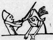
Φαουλής και Περικλέτος, ό καθέννας νέτος σκέτος.

Φύλλο του Ρωμηού και άλλο τήν Κυριακήν θά βγάλω.