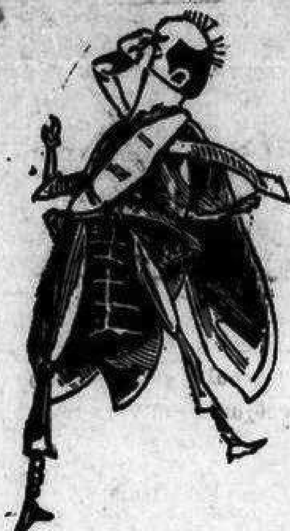
Τόνδε τόν μπουναμάν ὁ Φασουλῆς 'στὴν μειονοψηφίαν τῆς Βουλῆς.