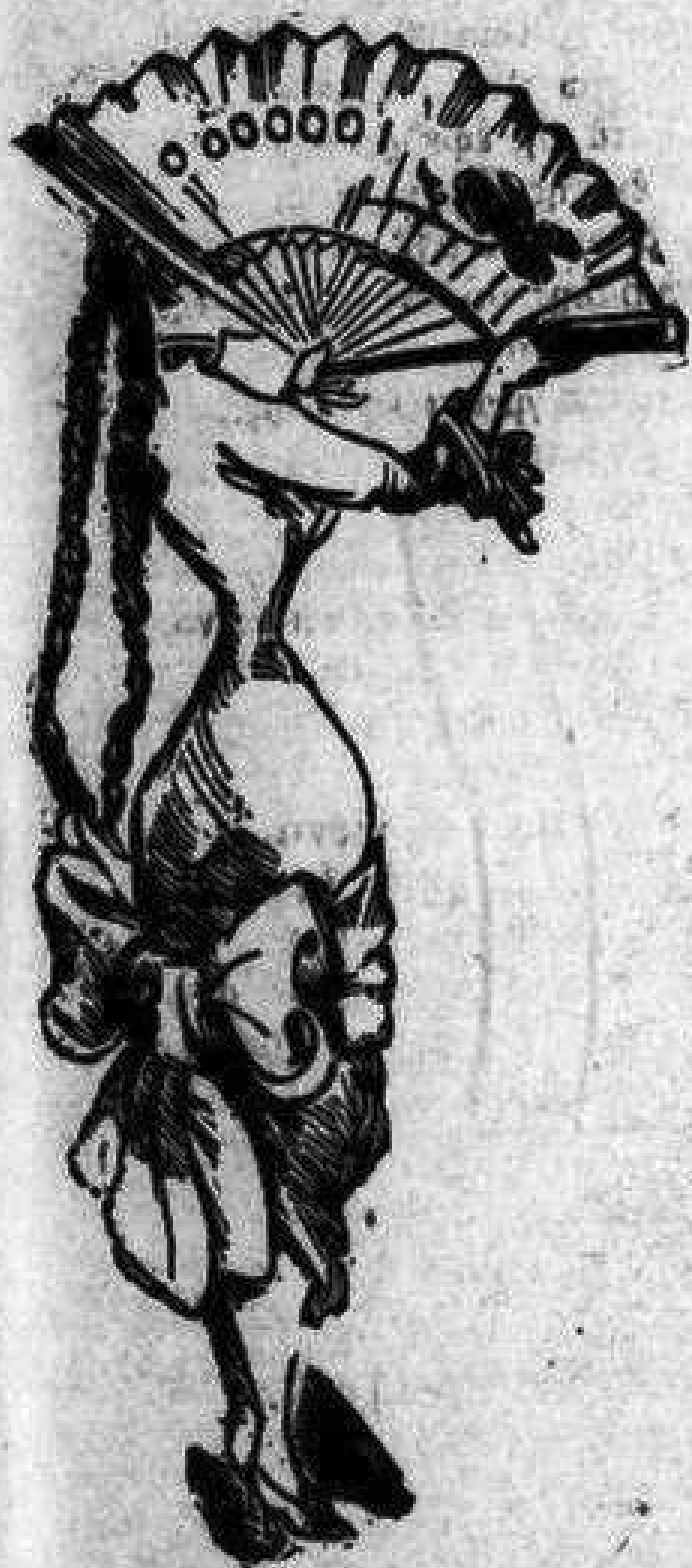
Μπουναμάς γιὰ τὸν Καζάζη, ὁποῦ ἔχει τόσο νάξι.