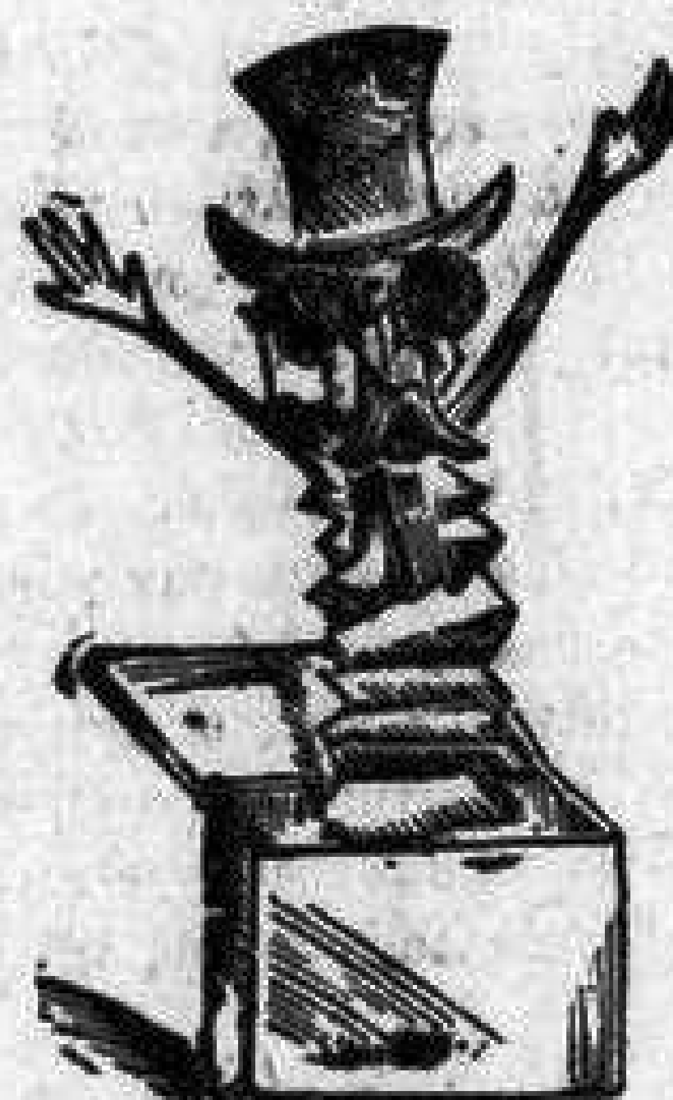
Μπουναμάς γιὰ τῆς κοπέλαις, ποῦ πεθαίνουν γιὰ τῆς τρέλλαις.