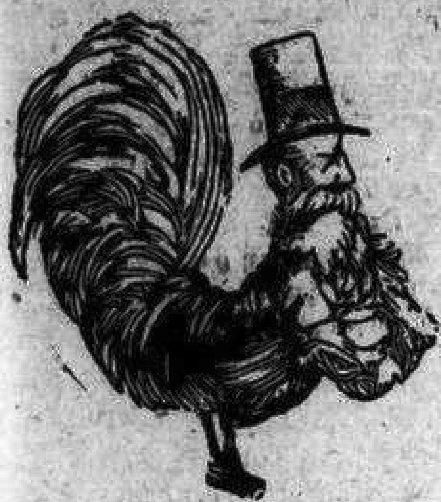
Τόνδε τόν μπουναμάν ὁ Φασουλῆς 'στὴν πλειονοψηφίαν τῆς Βουλῆς.