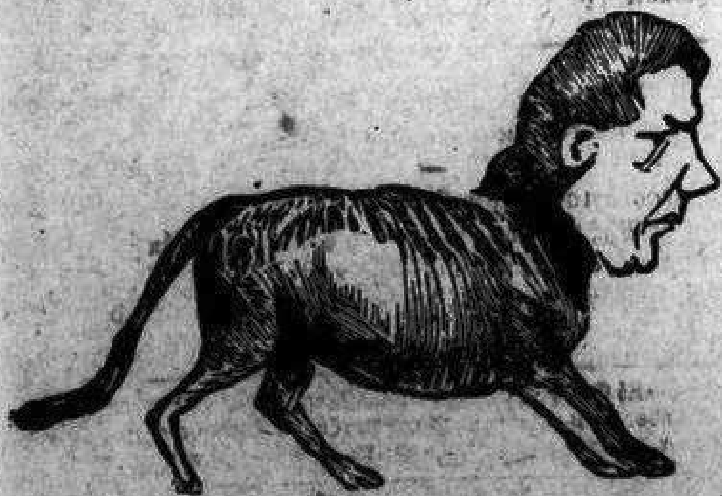
Μπουναμάς γιὰ τὸν Σουρῆ, ὁποῦ τόσο θὰ χαρῆ.