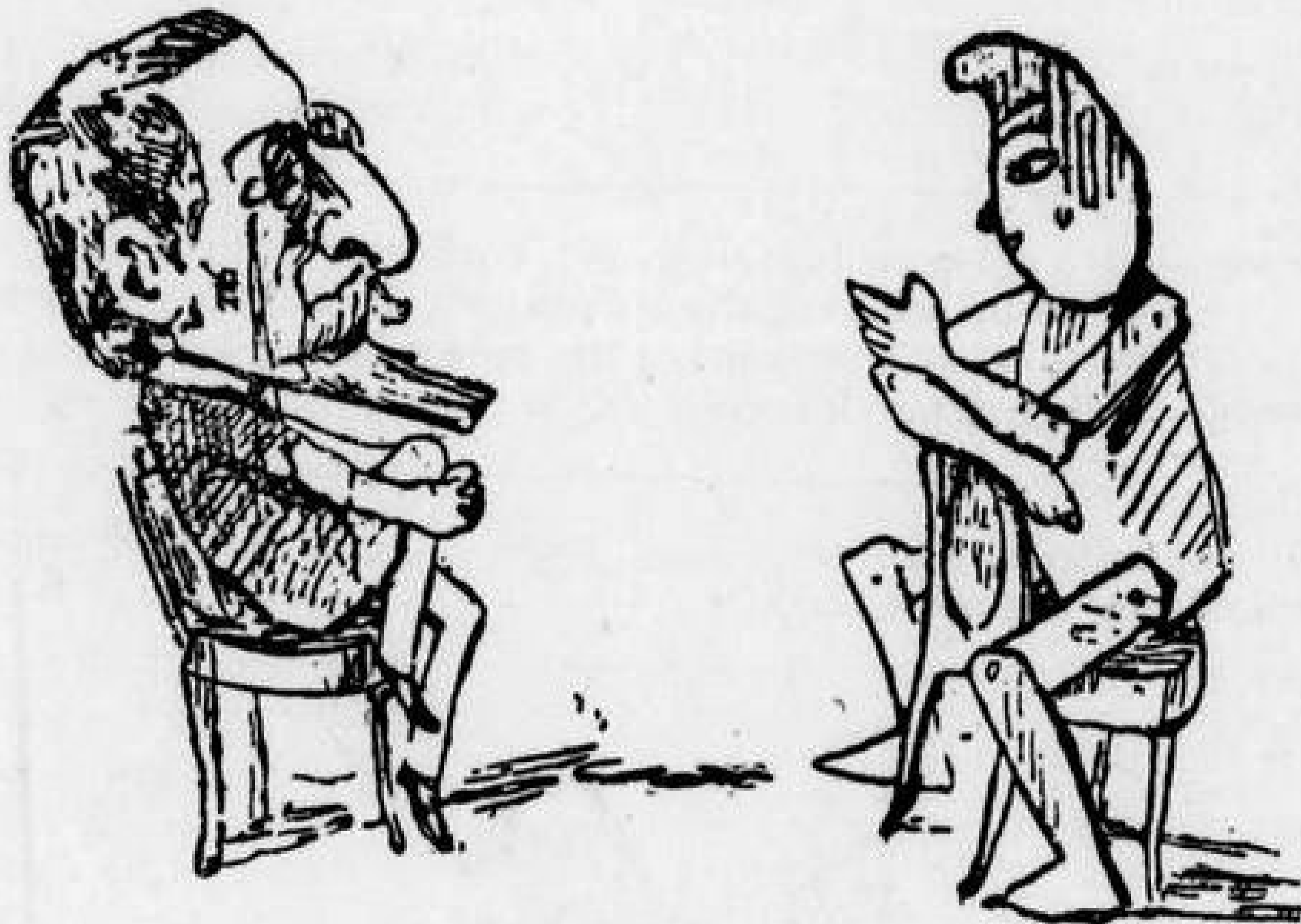
Ὁ Φασουλῆς κι' ὁ Καλλιγᾶς ἐν γένει γιὰ συναλλαγάς.

Π.—Ἀφοῦ τὸ θέλεις, ὄρσε δηὸ, καὶ ἴστα λουτρὰ πηγαίνω.