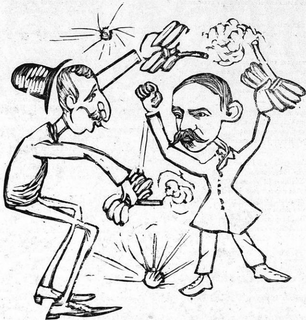
‘Ο Κόντες κί’ ό Σιμόπουλος μ’ όψεις πολεμικάς οίχθουν γιá χάρι τής Λαμπρής ύλας έκρηκτικάς.

Θάμβος συνεγχε τήν Βουλήν, κατάπληξις και τρόμος, κί’ όπόταν τών έκρηκτικών συνεζήτετ’ ό νόμος έκρήξις έξερράγησαν εις κοχλάζόντων στήθη, κί’ ό μακκρίτης πόλεμος έξαίφνης άνεστήθη, και πάντες ένθυμήθησαν τήν νικηφόρον πάλην... ένδόξως γάρ δεδοξάσεται τό κράτος τής και πάλιν.