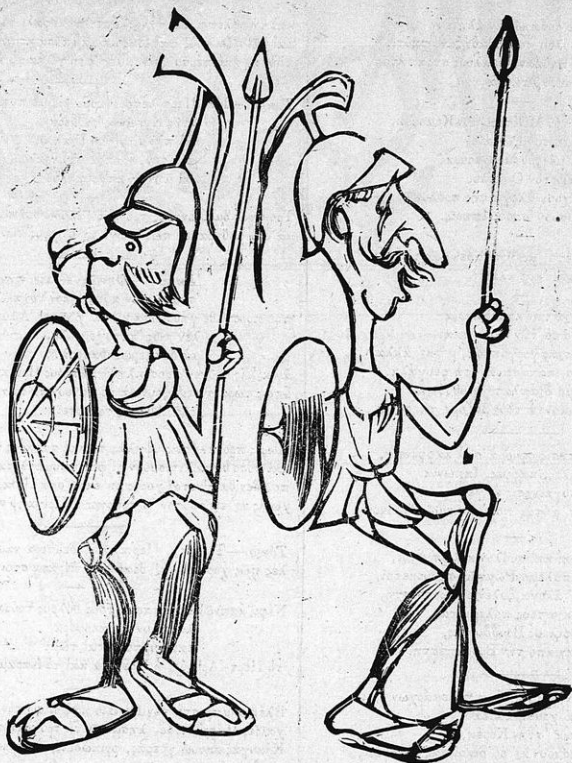
Σās είδα, οās λιμπίστηκα μē τā Μακεδονίστικα.

... τῆς ράτσας τῆς 'δικῆς μας πῶς κατάγεται κί' αὐτός, ... κί' γιὰ νάχη' στās θαλάσσιες τέτοιο θρίαμβο μεγάλο Ρωμῆς θάναι δίχως ἄλλο.