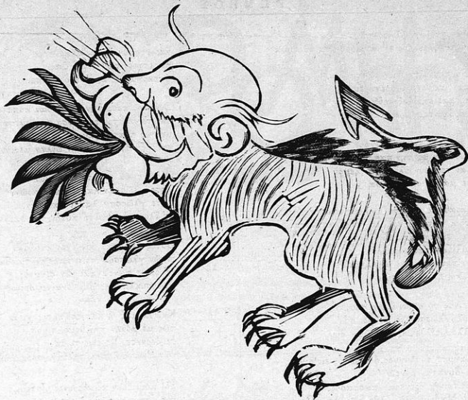
Πολύγλωσσον θηρίον, τρόμος Βουλευτηρίων.

κι' εἰς ἀπεργίας θερμοκαστῶν ταίριες ἀπκλάσσει.