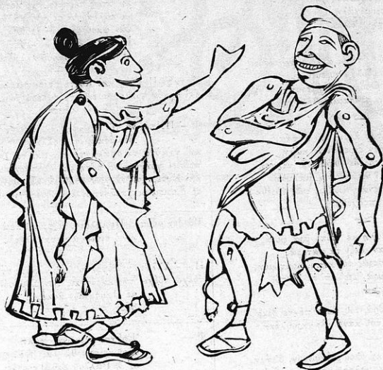
Ὁ Φασούλης κι ἡ Φασούλῃ ἐν παλαιᾷ περιβολῇ.

καὶ μέσ' ἀπὸ τὰ μνήματ' νὰ τρέχουν εἰς τὰ τμήματ'.