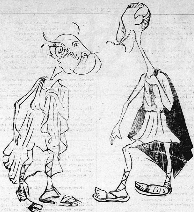
Τύποι πολιτικών τῶ μᾶλ' ἀρχαϊκῶν.

Κι φήνας ἀπεστόμισες φρικτῆς σηκωφοληξ κι' ἐλάλησες ἀπτόητος ἐμπρός εἰς γαρούς θεόνους... κκλημερούδω. Μῆσο μου... τῶπε κι' ὁ Βασιλῆς πὼς διπλωμάτῃ σὸν κλι σὲ δὲν εἶδε τῶρα χρόνους.