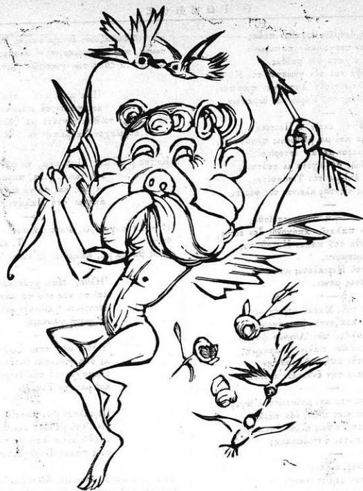
Μάϊος πολιτικός και παμπούς Κορδοβικός.

και να 'δουν τον Δη Χου Τσάγκ της Ελλάδος μας τον πάνυ, δηλαδή τον Θεωρή, τον τρανό Σκινδογιάννη.