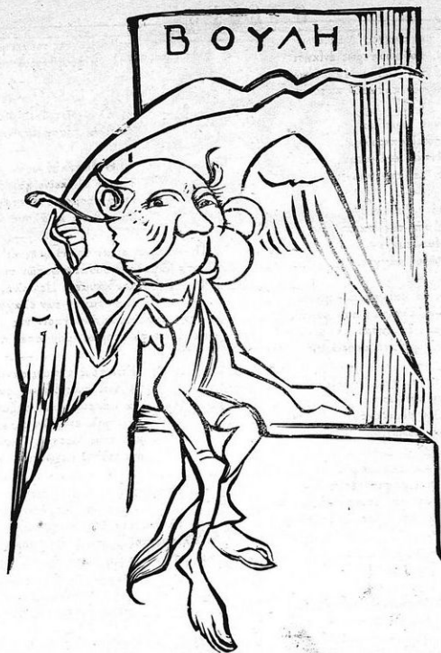
•Ο γέρος ὁ Δημοφελῆς ἄγγελος φάλαξ τῆς Βουλῆς.

Κι' ἐσκίρτων Ὀλυμποι Θεῶν καὶ τὰ βουνὰ τῆς Ἰδῆς κι' ἠ κνίσσα τῶν κοκορεσιῶν ἀνέβαινε ἦψιλά, κι' ὁ δίκαιος ὁ παλαιός, ὁ μέγας Ἀριστείδης, μπράτσο κι' αὐτὸς ἐπήγαγε μετὸν Ζυγομαχῆ, κι' ὠμίλου σοβαρότατα περὶ δικαιοσύνης καὶ ρουσπετιῶν παντοειδῶν τῆς νέας Ρωμωσύνης.