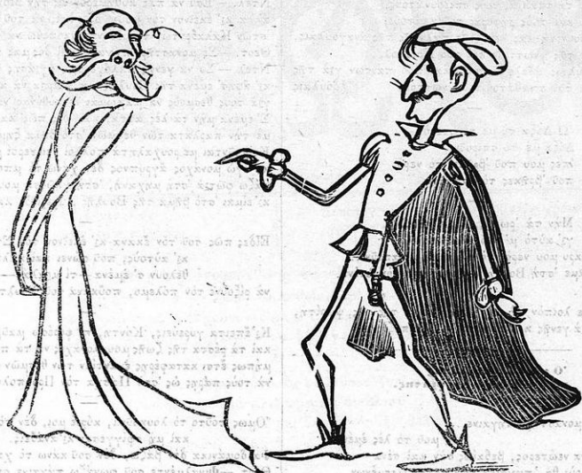
Χάμλετ κι' Όθελία κάνουν όμιλία.

Γιὰ τῆς Τραπέζης τὴ γιορτὴ δὲν ξέρεις πὼς ἐχάρηκα, καὶ τραγαμέντα ἔβγαλαν δίσκοι μ' ἑκατοστάρια, καὶ τότε ἔχημηξε πού λές προσκεκλημένον σπείρα, κι' ἐγὼ τοὺς ἀρπάζ' ἀρεκέτᾶ, καὶ πάρε μουλεγαν κι' αὐτᾶ, κι' ἐγὼ τοὺς ἔλεγα μεροὶ κι' εὐχαριστῶ σας, πῆρα.»