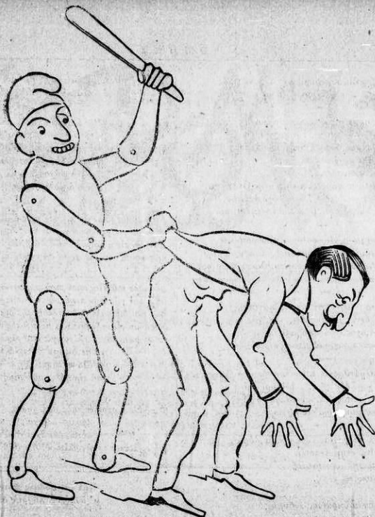
Δόξα' στους μεγάλους νούδες, που της τρών' στους πισινούδες.

Π.—Τὼν μαλλιαρῶν ἡ γλῶσσα δὲν εἰ γερμίζει πάθος, δοῦ δὲν ἔχεις ὕψος, δοῦ δὲν ἔχεις βάθος. Σὺ μόνο μὲ τὸν ὄχλο πεγαίνεις πλάι παιδί, δὲν ξέρεις τὴν Μιράννα, μήτε τὴν Λορέλν, πάνωρα μαγιάδα, τὰ σόγγραφα σκοτάδια, καὶ τίλλο, βρέ μαγκούφη, ποῦ δὲν τὰ νοιζοῦντο μπουφοί.