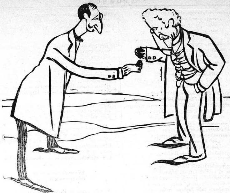
Λητμονοῦν τὸν καυγᾶ καὶ τσουχχρίζουν ταῦτά.