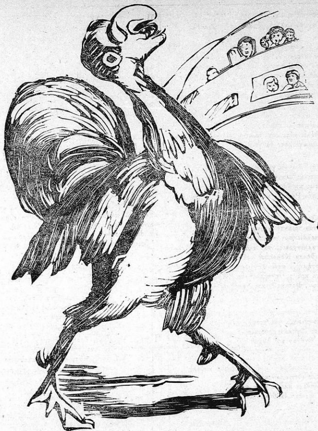
Με φούσκωμα πολύ τὴν νίκη διαλαλεῖ.

τοῦ βραβεύει κάθε κόπο τόση δόξα καὶ παρᾶς.