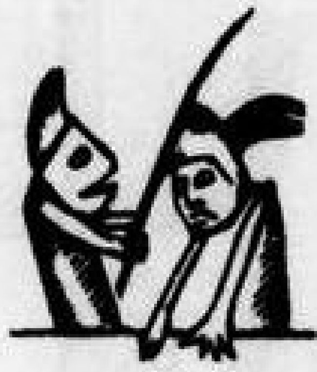
Φασουλῆς καὶ Περικλέτους, ὁ καθέννας νέτος σκέτος