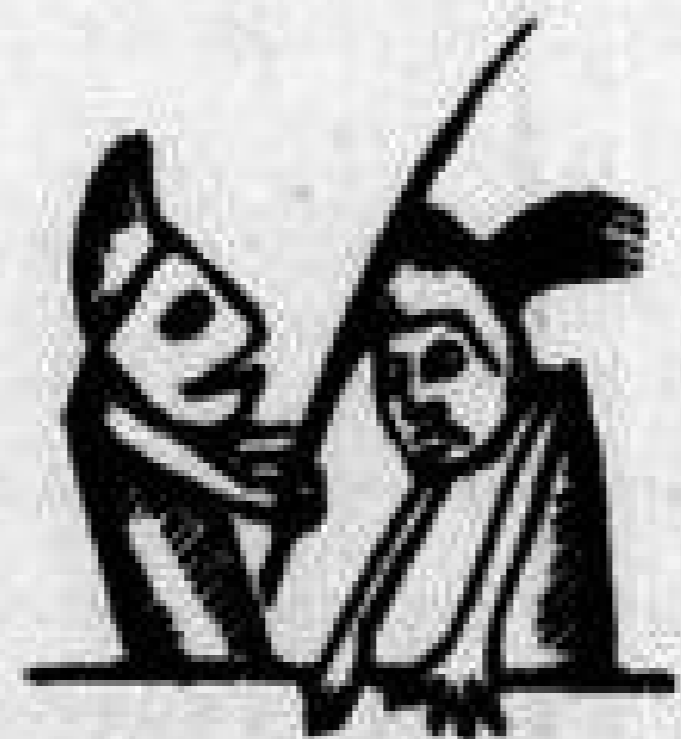
Περικλέτος Φασουλῆς, ὁ καθένας σεβνταλῆς.

Φ. — Μωρὲ σὺ εἶσαι, Περικλῆ, ἐσὺ ποῦ βλέπω 'μπρός μου ; ποῦ ἤσουν και ἀπ' τὸ πρόσωπο ἐγάθηκας τοῦ κόσμου ; Π. — Νάτα ! λοιπὸν δὲν τὰ μαθες ; ... εἶδινα ἐξετάσεις. Φ. — Τί ; ἐξετάσεις εἶδινες σὲ τέτοιαις περιστάσεις ; Μωρὲ ἐδῶ ἐγάλασε ὁ κόσμος 'στὴν Ἀθήνα, ἐδῶ, καλέ, πεθάνανε πολλοὶ ἀπὸ τὴν πείνα, ἐδῶ ὁ κόσμος τάχασε και ἦλθε ἀνω κάτω, ἐδῶ χρηματιστήριο, ἐκεῖ τὸ Συνδικάτο.