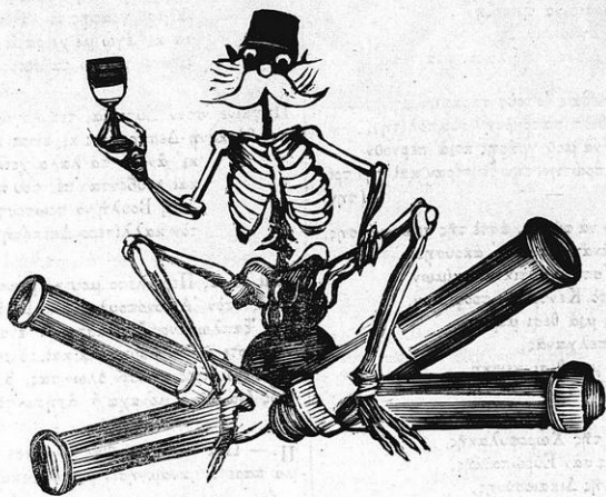
Ὁ Ζεὺς τοῦ Μπακοπούλου τοῦ Φειδίου ἐξ ἀγλῆς ἀπαυγάζων αἰδίου.

Καταλαλοῦν τὸν Κόντη μας, τὸν ζυμπακο τοῦ ψάλλου, ζητοῦν παντιέρας Ἀγγλικὰς στὰ σπήτια τῶν νὰ βὰ- κι' ἀπελπισμέν' οἱ καίφερο! (λουν, 'στοὺς Βουλευτὰς τῶν τώρα λὲν νὰ πᾶνε μὲ τὸν Σωλοσθουρῶ, τὸν Βάλφουρ καὶ τὸν Τσαμπερλαίν.