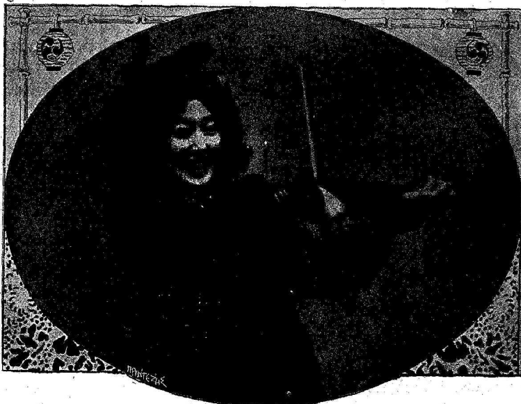
Ἡ ἐξοχωτέρη καλλιτέχνις τῆς Ἰαπωνίας ΣΑΔΑ ΓΙΑΚΟ

Ἡ ὄρατᾶ και χαριτωμένη Σάδα Γιάκο εἶνε ὁ ἀσὴρ τοῦ Ἰαπωνικοῦ θεάτρον. Τελειοποιηθεῖσα ἐν Γερ-