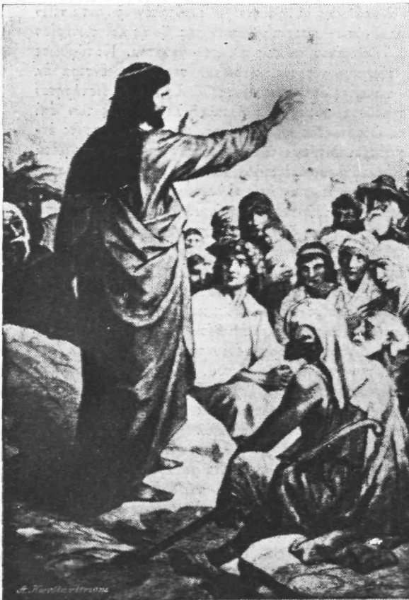
Ο Ίησοϋς διδάσκων επί του Όρους