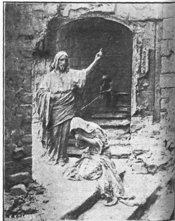
Μαρία ή Μαγδαληνή πρό των ποδών του Ίησοϋ.