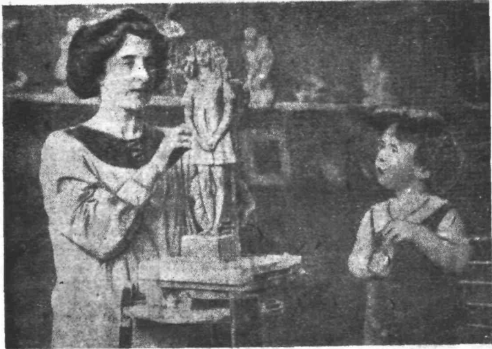
Ἡ κυρία Σκῶτ καὶ ὁ υἱὸς της

Ὁ πλοίαρχος Σκῶτ, ὁ ἀτρόμητος Ἴγγλος ἐρευνητῆς τοῦ Νοτίου Πόλου, ὁ μετὰ τύσης ψυχραιμίας προεπιπῶν τὸν θάνατον ἑαυτοῦ καὶ τῶν συντρόφων του, ἐν τῷ ἱστορικῷ καταστάντι ἡμερολογίῳ του, ἦτο καλλιτέχνης.