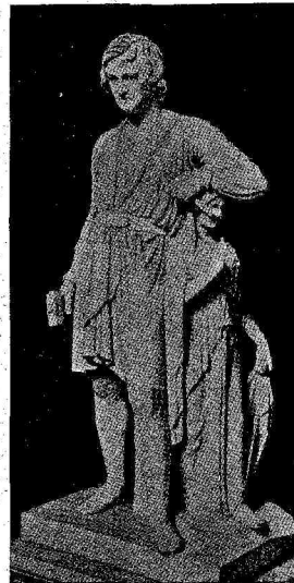
Σααμπύε. Σωσάννη Σούλτσ. Ἀδάμ και Εὔα Ὁ Ἰάσων τοῦ Τορβάλδσεν Ὁ Τορβάλδσεν Ἔργον ἰδίον