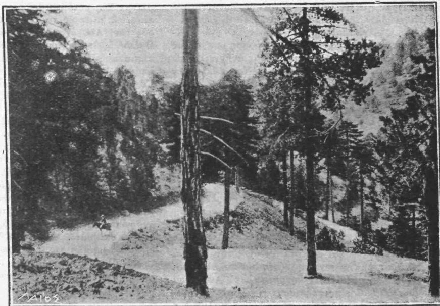
Ὁδὸς ἄγουθα εἰς τὸ Τρόδος.