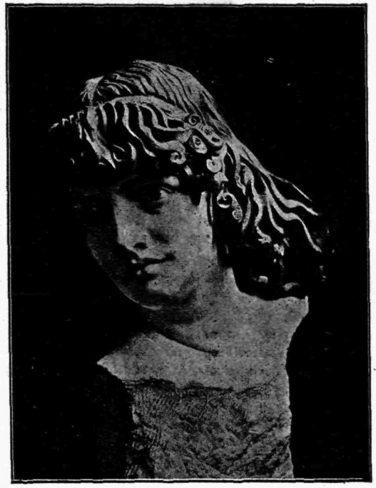
Richard König. Ἡ Μοῦσα (Μουσεῖον Δρεσδης)

φορον ἀπὸ τὸν ἰδικόν μας. Ἡ συμπάθειά μας αὐτὴ πρὸς τοὺτους εἶνε ἠγῶσιμός.