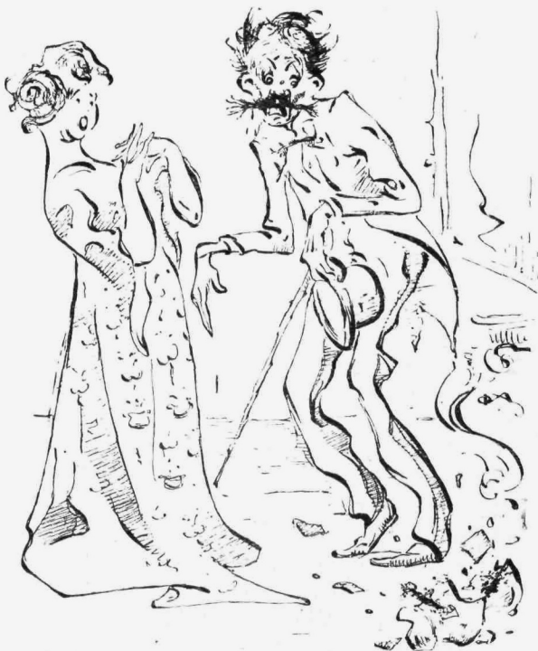
« Ἐν μέρος τοῦ σώματός μου κατέρριψε. . . »

Περιμένω ἐπὶ τέλους νὰ ἐμφανισθῇ ἡ Ἀγγελικὴ. Ἴσως μὲ εἶπε κουρδιστὴν ἵνα διὰ τοῦ ἀνυρπάντου αὐτοῦ τίτλου δικαιολογήσῃ τὴν ἐπίσκεψίν μου. Εἰς τὴν πρόσκλησιν τῆς ὀξυθύμου κυρίας ἐμφανίζεται τέλος πάντων ἡ πολυθρύλλητος Ἀγγελικὴ. Θεέ μου ! Ἄντι τῆς καλλονῆς μου ξεπροβάλλει, τί νομίζετε ; Μία δραπέτις θηριοτροφείου, μὲ μύτην ἀτελευτήτων διαστόσεων, μὲ δύο σαρίδας μίαν ἐμπρὸς ἀντὶ στήθους καὶ μίαν ὀπισθεν ἀντὶ ράχους καὶ μὲ δύο ξεθωριασμένα μάτια ποῦ ἔπρεπε νὰ εἶναι κανεὶς θεόστραβος διὰ νὰ τὰ ἀνεχθῇ. (Ἀναστενάξει). Μοῦ μειδιᾷ ἡ ἀντιπρόσωπος αὐτῆ τοῦ φθινεπώρου καὶ τί ἀνακαλύπτω νομίζετε ; Ἐνα καὶ ἡμισυ δόντι εἰς ἀμφοτέρας τὰς σιαγάνας. Τὰ δόντια τῆς εἶχαν γυμνάσια ἀραιᾶς φάλαγγος.