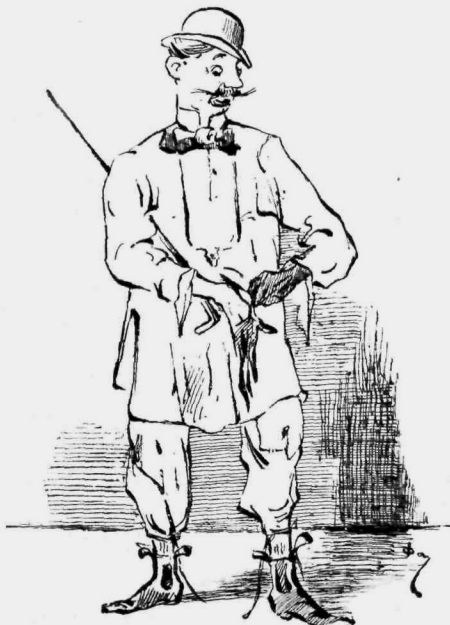
«Ἐνδύομαι κατὰ σχῆμα πρωθύστερον . . .»

Μόνον τοῦ δὲν παρεφρόνησα ἀπὸ τὴν χαρὰν μου. Ἐκείνο τὸ βράδυ ἐκάπνισα δύο πακέτα σιγάρα διὰ νὰ τὸ πιστεῦσετε δέ, σὰς βεβαιῶ ὅτι εἶνε ἀκόμη περασμένα εἰς τὰ βιβλία τοῦ καπνοπώλου μου. Ἐρρόφησα 5 ποτήρια μύρα εἰς ἓν ζυθοπωλεῖον, ἀπὸ τὸ ὁποῖον ἔκτατε δὲν περνῶ, καὶ ἔκαμ καὶ ἓνα περι-