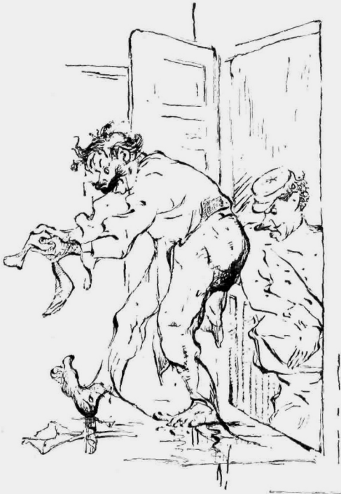
«Με τὰ νυκτικά μου, χωρίς κάλτσες . . .»