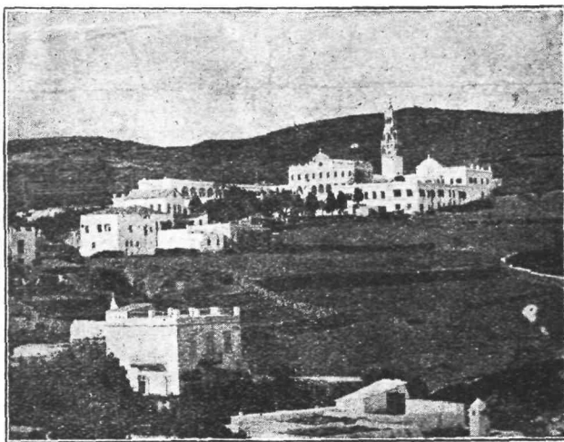
Ναὸς Εὐαγγελιστρίας ἐν Τήνω.

Ἐπὶ τὴν ἀπὸ τῶν ἀπο- ρενόμενος ἀρὰ τὰς καταφύτους παρό- δους τοῦ Ἀχιλλεῖου Παραδείσου μῆς ὠ- δήγησε πρὸ τοῦ θρή- σκοντος Ἀχιλλεῖος. Καὶ ἐνῶ ἢ φῶς γύ- ρω ἦρθε καὶ ἢ Κερ- κυραϊκὴ βλάστησις ἐπ.λασιώρε τὰς ἡρει- πόμενας οἰκοδομὰς μοῦ ἐφάρη ὅτι εἰς τὸ ἀλγος τῶν ὀφθαλ- μῶν καὶ εἰς τὴν σχε- δὸν ἀδιόρατον ὀσο- πασιν τῶν μαρμα- ρίνων χειλῶν διέ- κρητα τὴν θλίψιν ἐ- ρὸς θαλάττον, μῆς