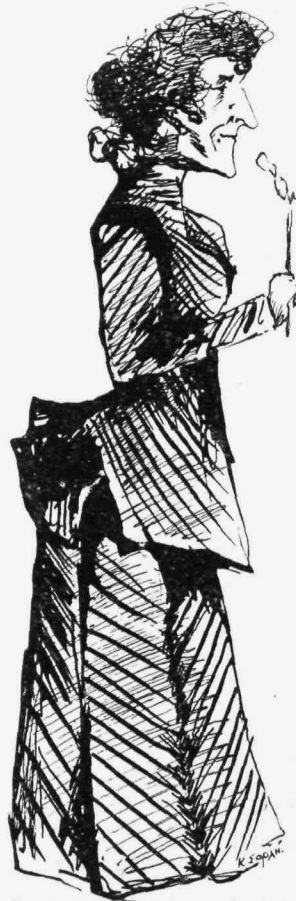
Μαργαρῶ δὲ ἦν γεροντοκόρη...

χρωματοπωλείου ἤνθιζον ἐπὶ τῶν παρειῶν της, ἢ μᾶλλον ἠδύλακον αὐτὰ ἢ μύτη της ἦτο μίαν τρανὴ ἀπόδειξις ὅτι εἶχε παρέλθῃ ἡμετήτωρ τὰ 40, τὸ ἀκρωτήριον δηλαδή τῆς Καλῆς Ἐλπίδος, διότι εἶχε σχῆμα ἀκριβῶς ἀκρωτηρίου.