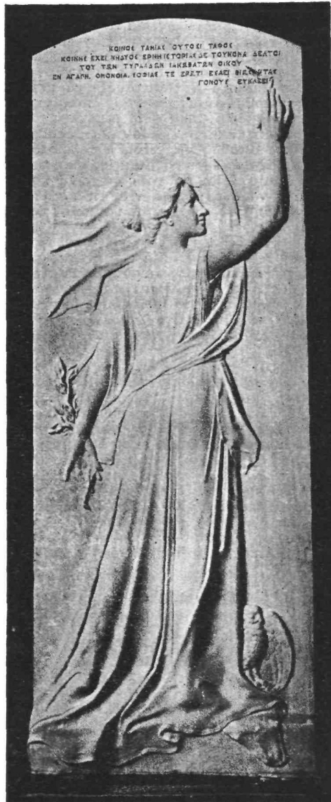
Γ. ΜΠΟΝΑΝΟΣ. Ἀνάγλυφον μνημείου Ἰακωβάτων

Ἀνερχόμενοι τὴν κλίμακα τῆς ζωϊκῆς ἐξελιξεως, τὴν αὐτὴν τάσιν τῆς ζωῆς βλέπομεν πρὸς τὴν τελειοποίησιν, ὑπὸ συνθήκας ὅμως πολὺ ὑψηλότερας καὶ τελειότερας. Ἡ χάρις καὶ ἡ κομψότης τῶν ἐρωτικῶν παιγνίων καὶ θηπειῶν τῶν ἀνωτέρων ζῴων, καθ' ἣν στιγμὴν πρόκειται τὸ εἶδος νὰ ὑψωθῇ εἰς ἐπίπεδον ἐξακολου-