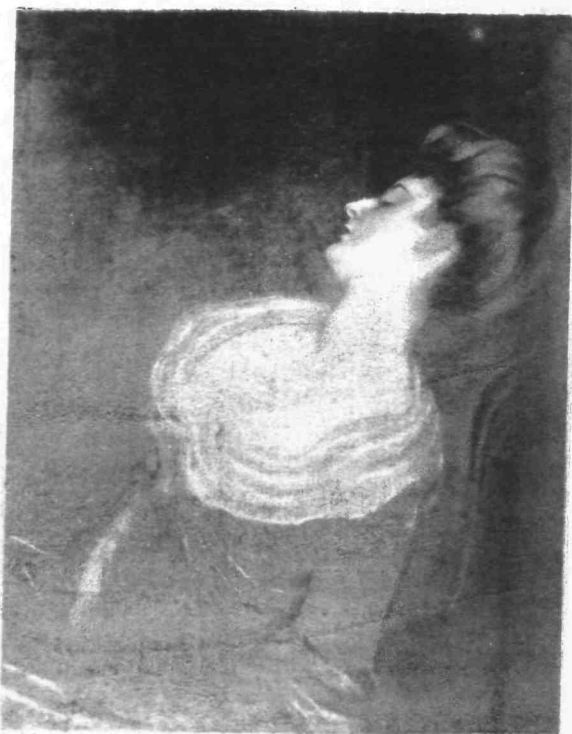
A. DE LA GANDARA.