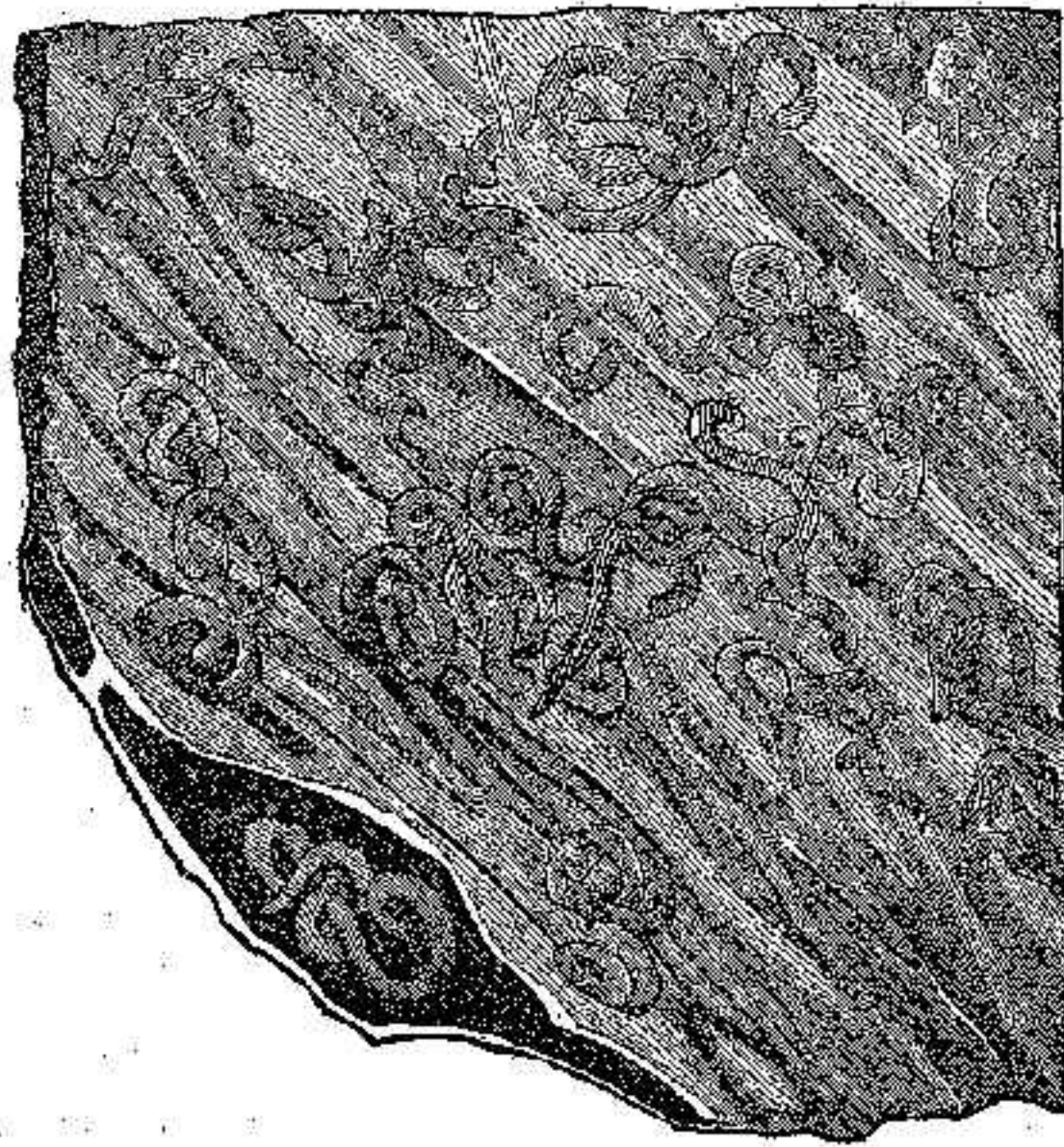
1 Τριχίς θήλεια πλήρης.—2 Μῆρος μυός περιέχοντος τριχίνας.—3 Μῆρος μυός περιέχοντος τριχίνας ὑπὸ μεγάλου μεγέθους 80.

καρκίνου μέγα ἀριθμὸν μικρῶν ὀειδῶν σωμάτων ἐπιμήκων, ἐνὸς χιλιομέτρου. Τὰ σώματα ταῦτα ἦσαν ἐναποθεθειμένα εἰς τοὺς θωρακικοὺς μύς καὶ εἰς