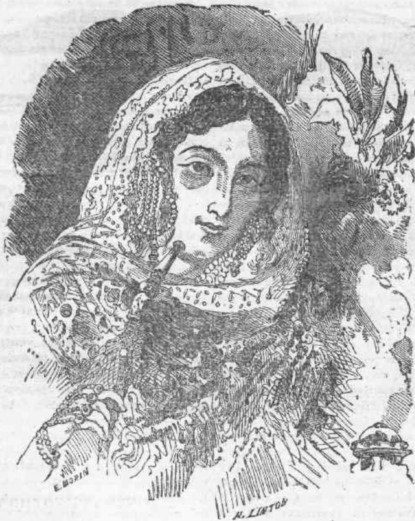
Ἡ βασίλισσα τῆς Οὐδης.

σπει γονεῖς γενηρακότας ἢ γήρας καὶ δυστυχεῖς μητέρας, καὶ ἄλλαι διασπειρόμεναι ἐντὸς καὶ ἐκτὸς τῆς Ἑλλάδος ν' ἀρσιωθῆτε εἰς τὸ δύσκολον μὲν ἀλλ' ἐθνωφελέστατον ἔργον τῆς ἠθικῆς διαπλάσεως καὶ διανοητικῆς ἐκπαιδεύσεως τοῦ φύλου εἰς τὸ ὁποῖον ἀνάγετε.