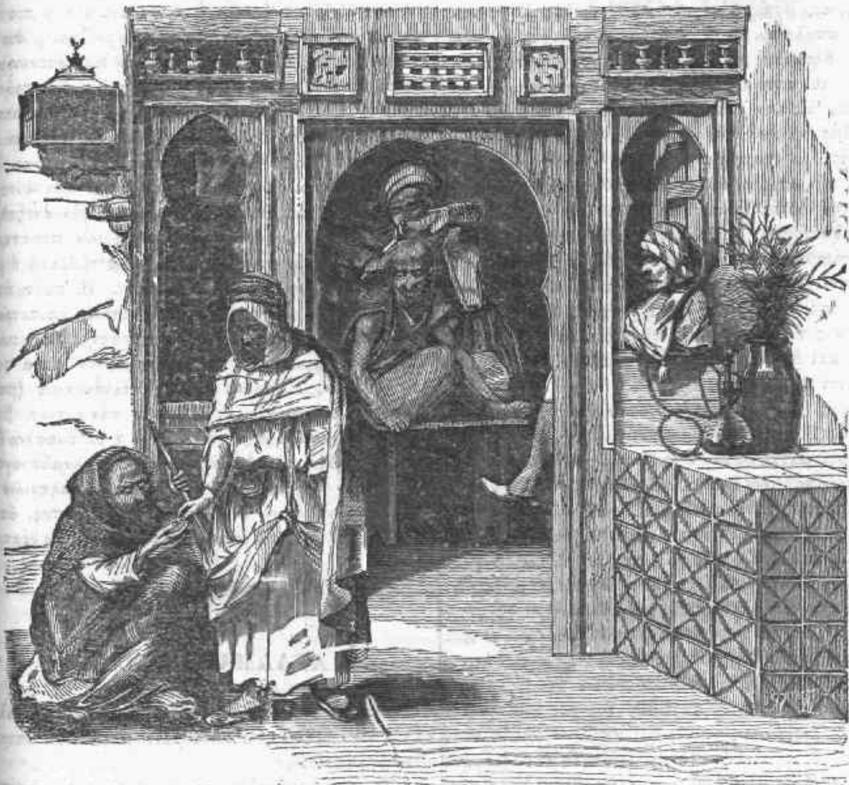
Κοιτῆριον ἐν Αἴγυπτῳ.

τῳ παρετήρησα ὅτι ὁ Μωάμεθ δέν ἦτον ποτὶ εἰς τήν Αἴγυπτον, ἐθροισθήσῃ οὐκ ἔτι, καί ἡ πίστις τοῦ ἐκλονίσθη, καί μοι ἐνομήθησαν ὅτι ὑπάρχον καί πολλά ὑποθαλαμικία ἱερά λαΐφανα. Ἄλλὰ μεθ' ὀρμηωτέραν σκέψιν, οἱ διασταμοί τοῦ δευλόθητον. « Ἰδοῦ, μοι εἶπεν, ἡ ἀπόδειξις ἦν ζητείς. Ὅλα τὰ γνήσια τοῦ προφήτου σημεῖα εἰσι πράσινα. Ὁ λίθος οὗτος εἶναι πράσινος καί αὐτίς. Ἐπομένως . . . » Τὸ συμπέρασμα ἦτον ἀναμφισβήτητο, καί μάλιστα ὅταν προσέθηκεν ὅτι καί τοῦ Μεγάλου Ἡρακλεῖο, τὸ ἴχνη ἐν τῳ προσκυνήματι τῳ πρὸς τὰ μεσημέρινα τοῦ Καΐρου, εἶναι πράσιον καί αὐτό!