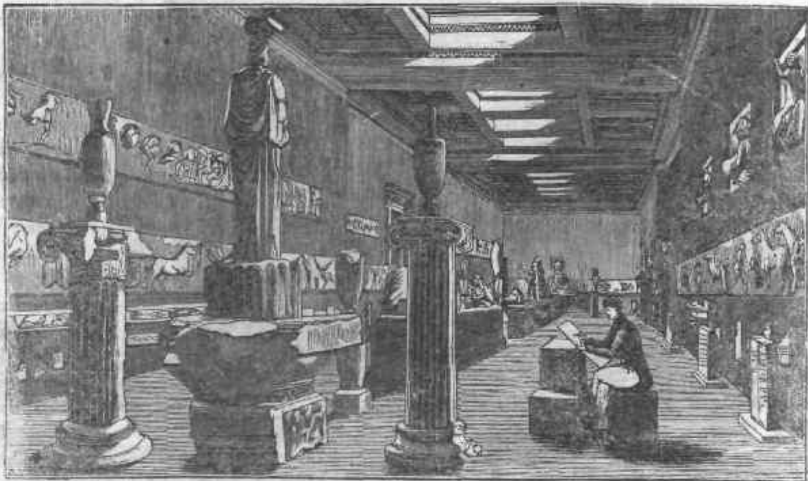
Τὸ ἐγγίνιον δωμάκιον.

στηριότητος πραιόντα εἰς τὰ ἐσχάτως κατὰ πρῶτον εἰς τὴν Εὐρώπην γνωσθέντα καλλιτεχνήματα ταῦτα. Τινὰ ἐξ αὐτῶν εἰσὶν ἀνάγλυφα, ἄλλα ἀγάλματα, φέροντα πολλάκις χρώματα ζωηρά, καὶ ἐνίοτε ἐλέγχοντα ῥυθμὸν αὐστηρὸν καὶ ἀρχαϊκόν, ἀντάξιον τοῦ ἐν Ἑλλάδι ἀμέσως προοδοποιήσαντος τὸν Φειδαϊκόν. Τινὰ εἰσὶ τάφοι εἰς σχῆμα κολοσσιαίων πυραμίδων, ὧν τὰ πλευρὰ καλύπτουσιν ἐπιγραφαὶ ἐκ μεγίστων καὶ καθαρῶσάτων γραμμάτων τῆς ἐγγωρίου, εἰσέτι ἀγνωστοῦ γλώσσης. Πολλὰ τῶν γραμμάτων τούτων εἰσὶν αὐτὰ τὰ Ἑλληνικὰ, ἄλλα δὲ ἐντελῶς διαφέρουσιν. Τινὰ τῶν μνημείων ἔχουσιν ἐπιγραφὰς διγλώσσους· ἐν μάλιστα ἔχει ὑπὲρ τὴν Λυκίακὴν ἐπιγραφὴν ἀντετραστιχὸν ἑλληνικόν, μνημονεῦον τὸν ἐπὶ Κύρου