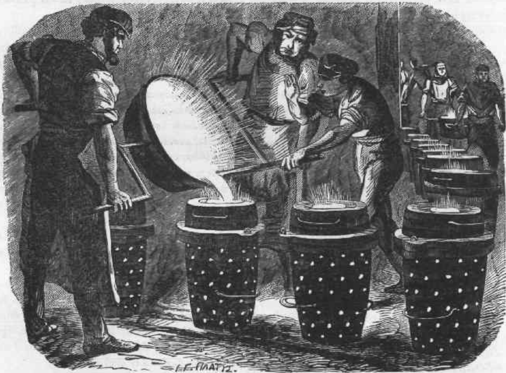
Χωρευτήριον σφαιρῶν Ἀρμιστρογγυίων κερροτίων ἐν Οὐόλουιχ.

πρὸς κατάφλεξιν τῆς πυρίτιδος χρησιμεύων σωλῆν διαφέρει ἐντελῶς τῆς μέχρι τοῦδε ἐν χρήσει σφύρας, κητεσκευάσται δὲ ἐκ χαλκοῦ καὶ περιέχει πυρίτιδα, προσαρμύζουσι δὲ αὐτῷ μικρὰν σιδηρᾶν ῥάβδον ἀνώμαλον περικεκλυμμένην ὑπὸ εὐφλέκτου πυρίτιδος. Ἡ ἐκ τῆς ἐλκύσεως τῆς ῥάβδου τᾶν τριβῆ