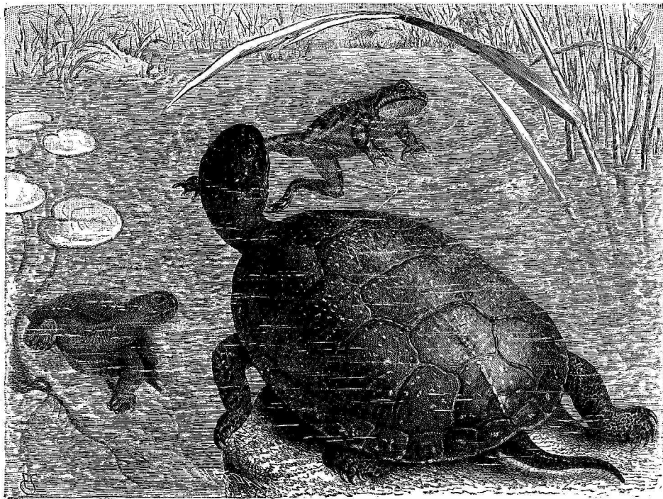
ΥΑΡΟΒΙΟΥ ΧΕΛΩΝΗΣ ΘΗΡΑ. Εἰκὼν ὑπὸ Αἰμ. Schmidt.

λήκ, ἔχουσα ἀπέ- ραντα ἄλση ρόδων καὶ μεγαλοπρεπε- στάτην περὶ αὐτὴν φυτεῖαν. Οἱ κά- τοικοὶ τῆς πόλεως ταύτης συμπο- σοῦνται εἰς 23,000, μεταξὺ τῶν ὁποίων πρωτεύει σχεδὸν τὸ μωαμεθανικὸν στοιχεῖον καὶ τοῦτο δίδει εἰς αὐ- τὴν χαρακτῆρα καὶ ὄψιν ἀνατολικῆς μᾶλλον πόλεως. Οἱ Τοῦρκοὶ κατοι- κοῦσιν ἐπὶ τῆς ἀνα- τολικῆς αὐτῆς πλευρᾶς, ἥτις ἔχει εὐρυτέρας διαστά- σεις καὶ ἐπισκιά- ζεται ὑπὸ ἐξαισιῶν δευδροφυτειῶν, ἰδίᾳ καρῶν, κα-