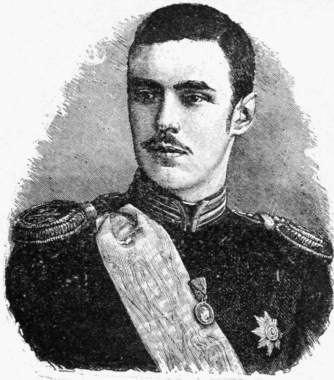
Ὁ Διάδοχος τῆς Ρωσίας Μέγας Δούξ Γεώργιος

σάν τὸ μετάξι. Καθίζω τώρα καὶ μοῦ τὰ μπλέκεις, νὰ σέ χαρῶ, γιατί ὅπου νὰ εἶναι θὰ φανοῦν κ' οἱ ἄλλοι.