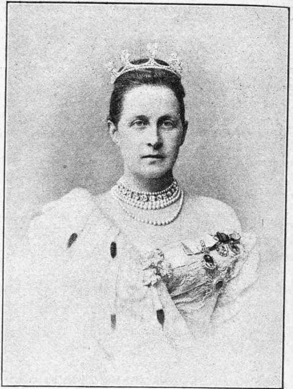
Ἡ Βασίλισσα Ὀλγα

Ὁ περιηγητὴς οὗτος, Ἡρακλείδης ὁ κριτικὸς καλούμενος, τοῦ ὁποίου ἀποσπάσματα μόνον δυστυχῶς σώζονται ἐκ τινος πολυῦ ἀξιολόγου Ὀδοιπορικοῦ τῆς Ἑλλάδος, ἤκμασε κατὰ τὸν ὅσον πρὸ Χριστοῦ αἰῶνα (περὶ τὰ 250), γράφει δὲ ἐξ αὐτοψίας προφανῶς περὶ τῶν Θηβῶν τῆς ἐποχῆς του τὰ ἐξῆς: «Ἡ πόλις τῶν Θηβῶν ἐν μέσῳ τῆς τῶν Βοιωτῶν κείται χώρας, περίμετρον ἔχουσα σταδίων Ὀ'. πᾶσα δ' ὀμαλή· στρογγύλη μὲν τῷ σχήματι, τῇ χροῇ δὲ μελάγγειος· ἀρχαία μὲν οὖσα, καινῶς δ' ἐρρυμοτομημένη διὰ τὸ τρεῖς ἡδῆ, ὡς φασιν αἱ ἱστορίαι, κατεσκάφθη διὰ τὸ βάρος καί τὴν ὑπερθερμάναν τῶν κατοικούντων. Καί ἵπποτρόφος δὲ ἀγαθὴ, κάθυδρος πᾶσα, γλωρὰ τε καί γεώλορος, κηπεύματα ἔχουσα πλείστα τῶν ἐν τῇ Ἑλλάδι πόλεων. Καί γὰρ ποταμοὶ ῥέουσι δι' αὐτῆς δύο τὸ ὑποκείμενον τῇ πόλει πεδίον πᾶν ἀρδεύοντες». Ἡ περιγραφή ἀρμόζει ὠραία εἰς τὴν φύσιν τῆς χώρας καί τὴν θέσιν τῆς πόλεως, ἐκ πρώτης δὲ ὄψεως καί τὸ μέγεθος αὐτῆς ὄχι μόνον διόλου δὲν φαίνεται ὑπερβολικόν, ἀλλὰ καί ὁλως διόλου ἀνάλογον πρὸς τὰ ὄρια, τὰ ὁποῖα ὑποδηλοῖ ὁ περιηγητὴς διὰ τῶν λόγων του ὅτι «ποταμοὶ ῥέουσι δι' αὐτῆς δύο». Διότι βεβαίως οἱ ποταμοὶ οὗτοι δὲν δύνανται νά εἶνε ἄλλοι ἢ ἡ Δίρκη καί ὁ Ἰσμηνός, ἐπειδὴ τρίτον ῥεῦμα δὲν ὑπάρχει οὔτε ἀναφέρεται ἐπὶ τινος ὑπάρξαν, τὴν δὲ ξηρὰν ῥευματιὰν τῆς κοίτης ὁδοῦ, δι' ἧς τὸ πολὺ ἐν βροχεραῖς ἡμέραις ὀλίγον ὕδωρ δύναται νά ῥεῦσῃ, δὲν ἦτο δυνατόν ὁ Ἡρακλείδης νά ἐκλάβῃ καί ὀνομάσῃ ποταμόν. Ὁ Φαβρίκιος πιστεύει ἀληθῶς τοῦτο, ἀλλὰ μὲ τὴν γνώμην του δὲν θά συμφωνήσῃ νομίζω