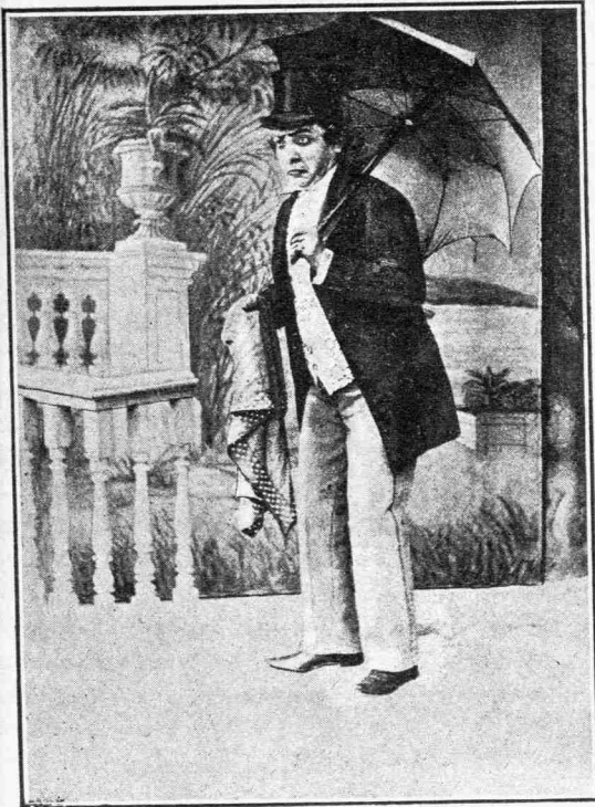
«Ὁ ἀριθμὸς 13»

γνώμης ἄλλου, ὁ κριτικὸς πρέπει νὰ ἐξετάζη πῶς διατίθεται αὐτὸς ὁ ἴδιος πρὸ τοῦ καλλιτέχνη ἢ τοῦ καλλιτεχνήματος. Ὁ Παντόπουλος ἀποτελεῖ μίαν τῶν ἰδιαιτέρων μου συμπαθειῶν. Ἀπὸ τῆς πρώτης φορᾶς καθ' ἣν τὸν εἶδα ἀπὸ σκηνῆς — ἐπαίξε τὸ περίφημον ἐκεῖνο Βέβαια, βέβαια! — εἰσῆλθε βαθύως, βαθύτατα εἰς τὴν ἐκτίμησίν μου καὶ ἤσκησεν ἐπίδρασιν ἐπὶ τῶν νεύρων μου καὶ ἐγένετο κύριος, ὁ μόνος ἐκ τῶν ὁμοτέχνων κύριος τοῦ γέλωτός μου. Εὐ-