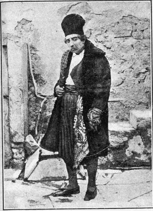
«Τύχη τῆς Μαρούλας»