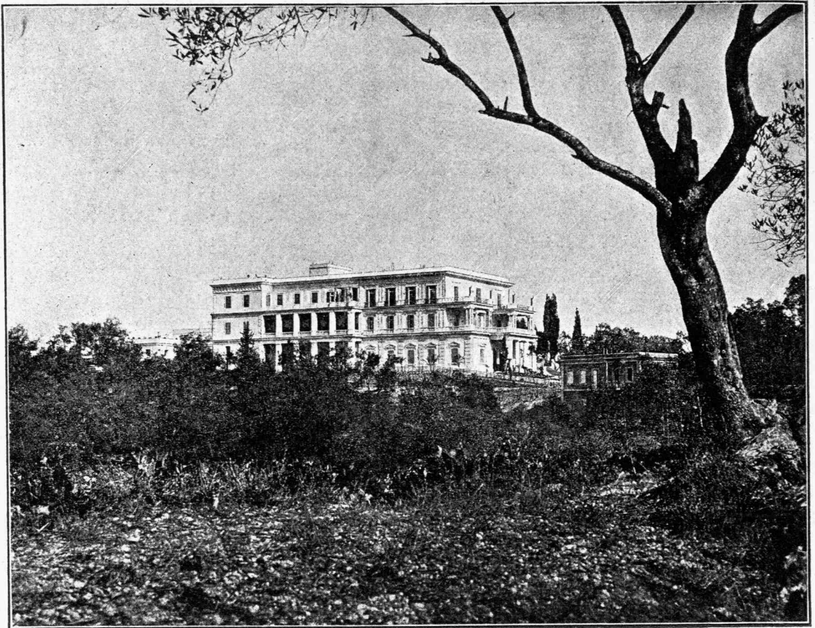
ΤΟ ΕΝ ΚΕΡΚΥΡΑ ΑΝΑΚΤΟΡΟΝ ΤΗΣ ΑΥΤΟΚΡΑΤΕΙΑΣ ΕΛΙΣΑΒΕΤ