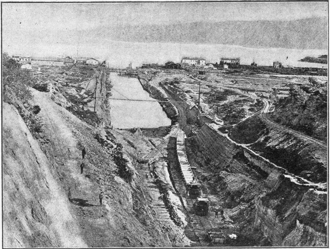
ΑΠΟΨΙΣ ΤΗΣ ΙΣΘΜΙΑΣ